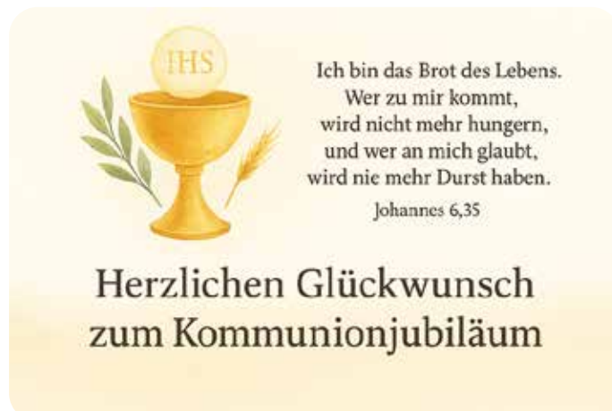
Bild: Evelyn Finkler, erstellt in Dall-E Text: Evelyn Finkler, Gemeindereferentin

Am Ende dieser Feiern sprechen wir allen Kommu- nionjubilaren herzliche Glück und Segenswünsche aus. Möge Gott sie weiterhin auf ihrem Weg beglei- ten, ihnen Vertrauen, Kraft und Zuversicht schenken und sie im Glauben stärken. Wir wünschen ihnen einen weiterhin guten Weg des Glaubens und der Treue zu Gott.