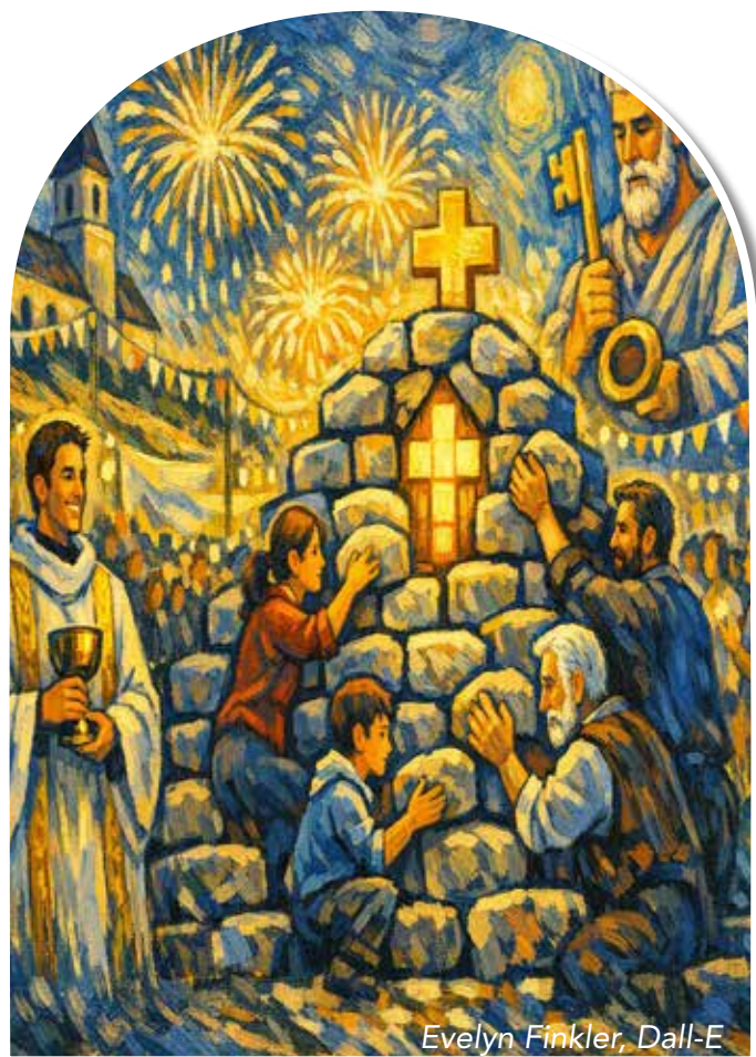
Evelyn Finkler, Dall-E

Dieser Vers bringt auf den Punkt, was uns in diesen Tagen bewegt: Kirche lebt von Menschen, von ihrer Hingabe, von ihrem Glauben und von ihrer Bereit-